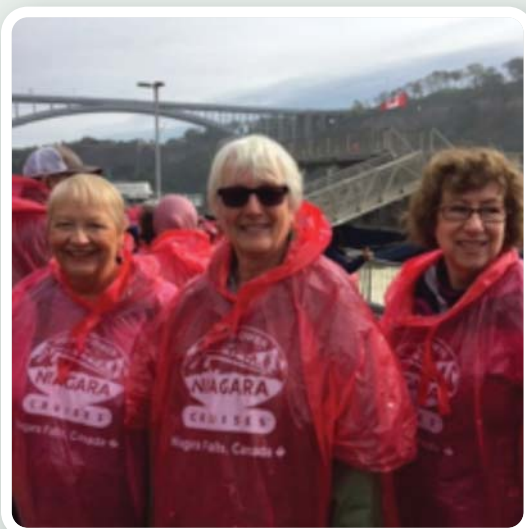
Prêtes pour les chutes!

Nos membres se sont évadés de leur quotidien pendant quelques jours lors de l'activité « Séjour Niagara » tenue du 6 au 9 octobre 2019. Nos participants ont profité d'une température clémente pour l'occasion, ce qui a permis de faire de belles visites guidées, dont un vignoble, la traditionnelle excursion en bateau des chutes Niagara ainsi que le tour de ville. L'activité s'est bien déroulée au bonheur de tous nos participants!