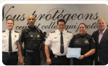
Le PDQ 3 a vendu 1397 repas

Pandémie oblige, c'est le 22 juin dernier qu'aura eu lieu le dîner reconnaissance pour l'activité des Fèves au lard de... 2019. Nous avons alors atteint 18 158 repas distribués! En plus de la clôture de la dernière édition, l'édition 2022 a pu être lancée au siège social de la Fraternité. Le repas a été agrémenté d'allocutions et de la remise des plaques. Partenaires, commanditaires, bénévoles, policiers et policières impliqués se sont retrouvés pour souligner cet événement organisé par la Fraternité et soutenu par le SPVM.