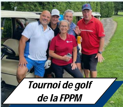
Tournoi de golf de la FPPM