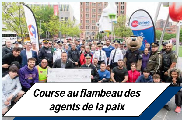
Course au flambeau des agents de la paix