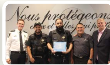
Le PDQ 26 a vendu 1144 repas