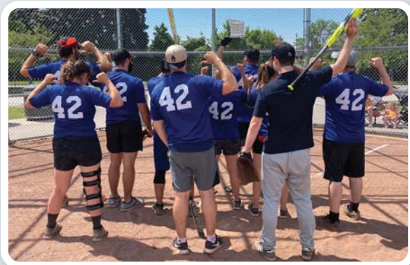
PDQ 42 DOS