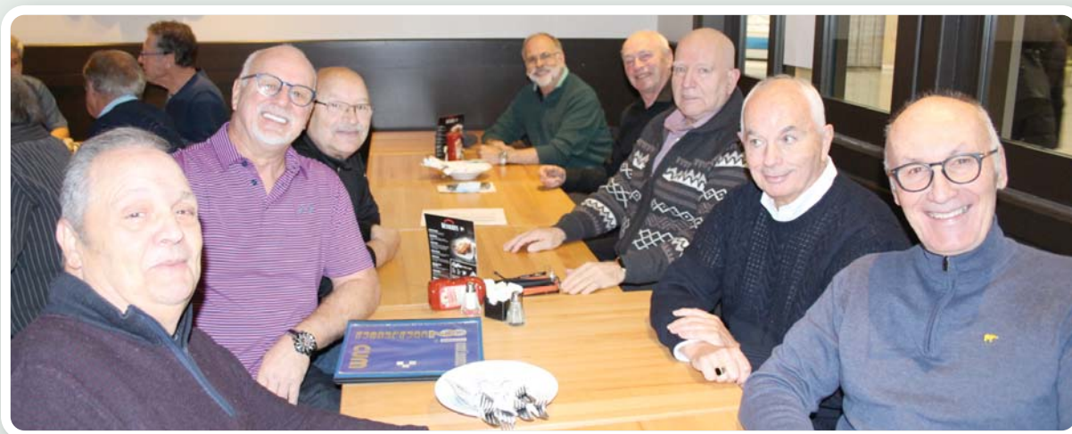
Quelques participants au 50 e du 2 e contingent