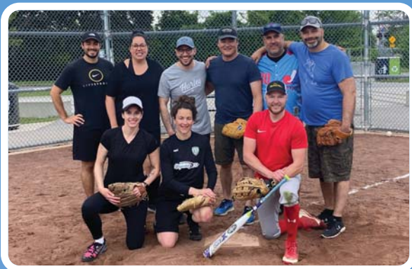
CENTRE EQUÊTE SUD