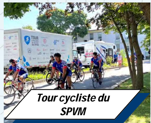
Tour cycliste du SPVM

www.caisse-police.com pour mieux vous informer !