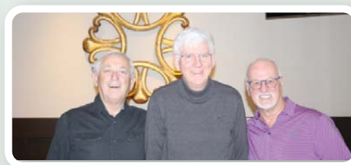
Anciens du poste 17