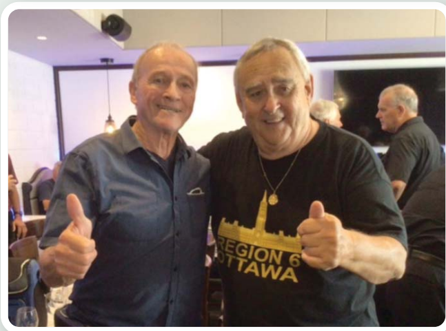
Organisateurs du 50 e anniversaire du 2 e contingent