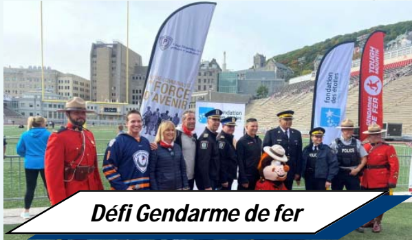
Défi Gendarme de fer